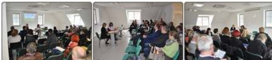
Slika 4: Skupščina LAS, 8. 3. 2016

Pripravili smo dopolnitve k Strategiji lokalnega razvoja (LRS) za LAS »Od Pohorja do Bohorja«, skladno z dopolnitvami je bila izvedena tudi 2. Skupščina članov LAS »Od Pohorja do Bohorja«. Organizirali in izvedli smo sejo Sveta županov LAS in 2 seji Upravnega odbora LAS, ter 1 sejo Nadzornega odbora LAS. Za potrebe izvedbe sej smo pripravili ustrezno dokumentacijo.