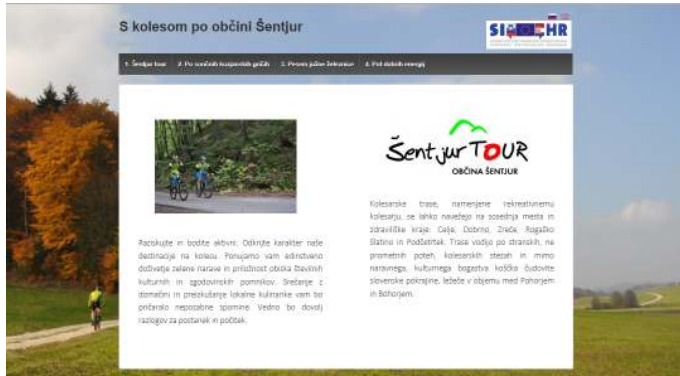
Slika 1: Spletna stran s predstavitvijo kolesarskih poti