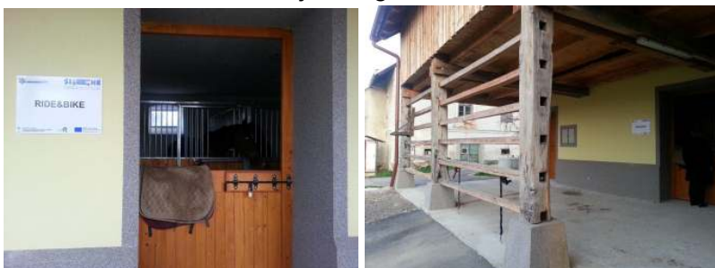
Slika3: Počivališče za konje, Blagovna

Zaključena je bila naložba v počivališče za konje na Konjeniškem centru Blagovna.